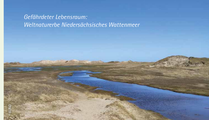
Gefährdeter Lebensraum: Weltnaturerbe Niedersächsisches Wattenmeer