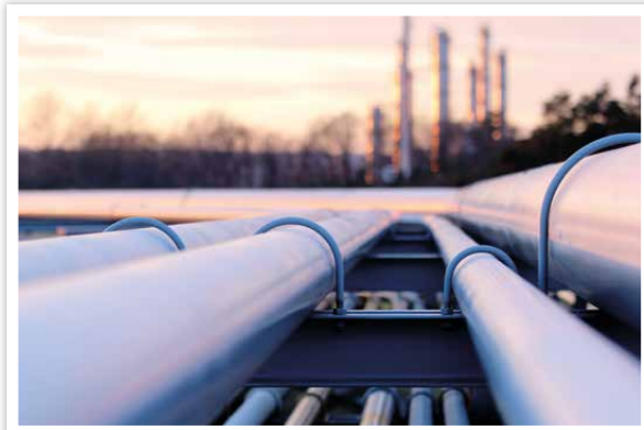
Schwimmende LNG-Terminals in Wilhelmshaven und Brunsbüttel wurden bereits eröffnet. Gleichzeitig laufen die Planungen für weitere Standorte wie beispielsweise Stade.

An der Nord- und Ostsee sollen insgesamt bis zu 12 Terminals für die Anlandung und Speicherung von Flüssigerdgas gebaut werden. Hier legen die mit Flüssigerdgas beladenen Tankschiffe an. Das LNG wird dort wieder in den gasförmigen Zustand umgewandelt (regasifiziert) und anschließend in das Gasnetz an Land eingespeist.