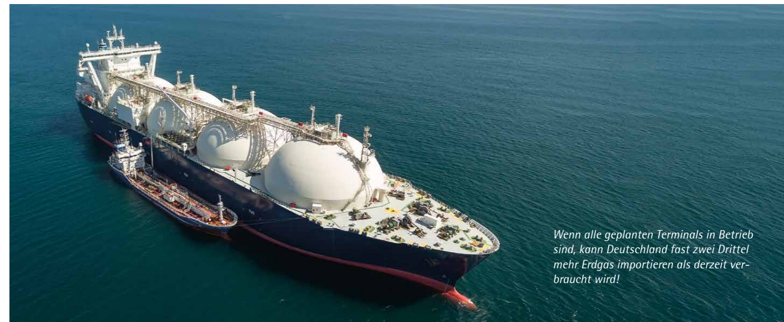
Wenn alle geplanten Terminals in Betrieb sind, kann Deutschland fast zwei Drittel mehr Erdgas importieren als derzeit verbraucht wird!